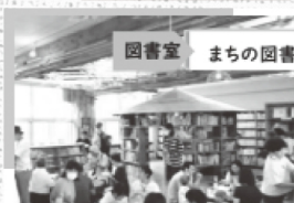
図書室 まちの図書室