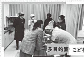
多目的室 こども食堂