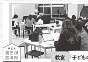
子ども第三の居場所