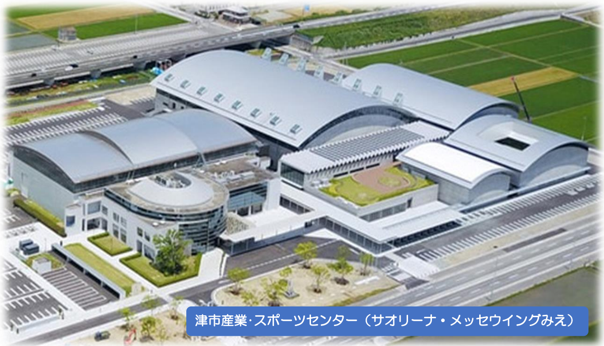
津市産業・スポーツセンター（サオリーナ・メッセウイングみえ）

地元テーマ じんけんぶんか たし 人権文化を確かなものに しちょう そしきりょく とりくみ ぶか ～29市町の組織力と取組をさらに深めて～